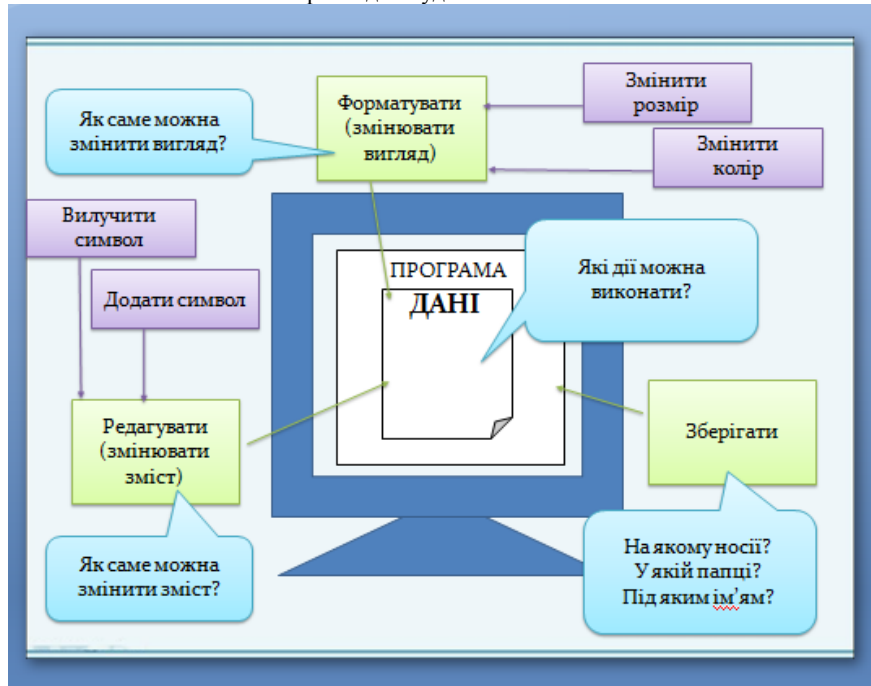
Рис.3. Орієнтовний вигляд частини результатів діяльності

Поданий приклад демонструє застосування одного з можливих методів навчання, у яких учитель виступає не носієм знань, а тільки організовує процес їх самостійного здобуття, спрямовує й координує навчально-пізнавальну діяльність, знаходячись у постійному діалозі з учнями.